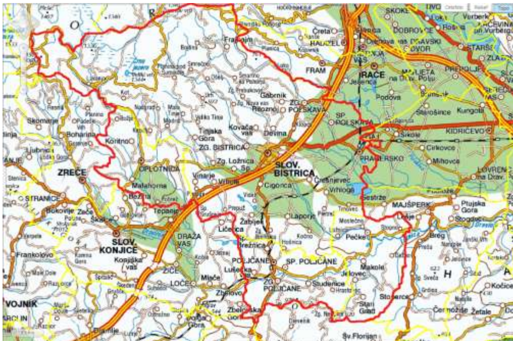
Slika 8-1: Prikaz območja izvajanja storitev ZD Slovenska Bistrica

Svojo dejavnost ZD Slovenska Bistrica izvaja na območju občin ustanoviteljic, to so poleg občine Slovenska Bistrica še občine Makole, Poljčane in Oplotnica. Območje delovanja obsega okoli 367 km 2 površine.