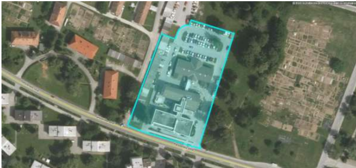
Slika 8-2: Mikrolokacija Zdravstvenega doma Slovenska Bistrica