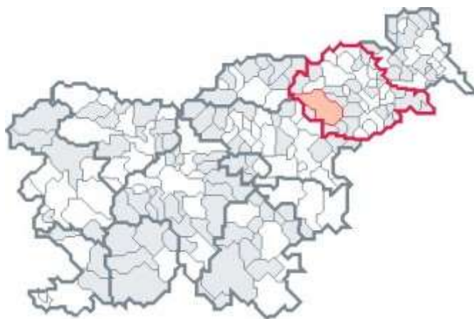
Slika 3-1: Podravska regija z občino Slovenska Bistrica

Problemi se koncentrirajo predvsem v kohezijski regiji Vzhodna Slovenija, ki je po zadnjih razpoložljivih podatkih za leto 2003 dosegala le 62,6% povprečne ravni razvitosti EU-25, in katere sestavni del je tudi občina Slovenska Bistrica. Za primerjavo: kohezijska regija Zahodna Slovenija je v istem obdobju dosegala 91,7% povprečne letne razvitosti EU-25.